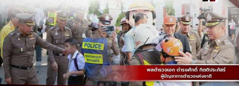
พลตำรวจเอก ดำรงศักดิ์ กิตติประภัสร์ ผู้บัญชาการตำรวจแห่งชาติ