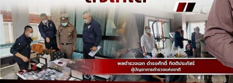
พลตำรวจเอก ดำรงศักดิ์ กิตติประภัสร์ ผู้บัญชาการตำรวจแห่งชาติ

// ต้องลดสถิติ คดีอาชญากรรม ทางเทคโนโลยี ลงให้ได้